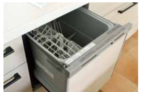
▲ 食器洗い乾燥機付

人造大理石製のワークトップは、お手入れがしやすく、耐久性に優れています。ガラストップの3口コンロや、浄水機能付水栓を採用した、使い勝手の良いキッチンです。