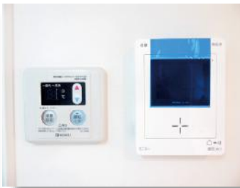
カラーモニター インターホン