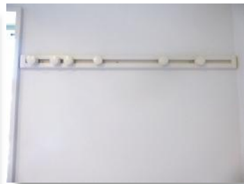
ピクチャーレール