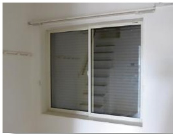
シャッター カーテンレール